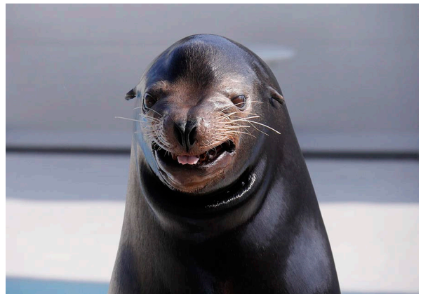
笑うアシカ Smiling sea lion

株式会社グランビスタ ホテル&リゾート（本社：東京都千代田区、代表取締役社長：須田貞則）の基幹施設である鴨川シーワールド（千葉県鴨川市、館長：勝俣浩）では、2023年の1月10日（火）～2月28日（火）の期間中、日本国以外のパスポート提示で、入館料金が半額となる「ウェルカムビジターキャンペーン」を開催します。