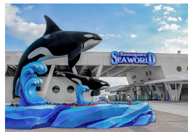
メインゲート Main Gate